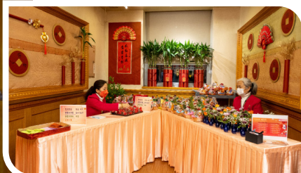
紐約佛光山的義工們為道場的新春活動保駕護航。