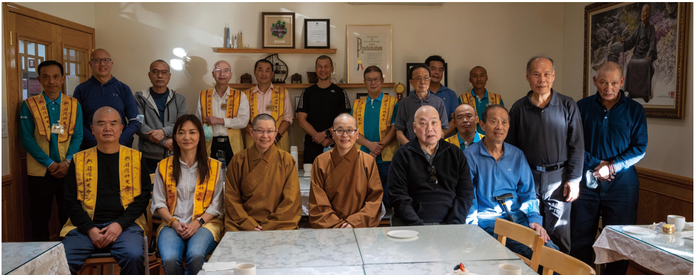
文 / 祝靜瑩

隨著疫情趨緩，佛光山紐約道場金剛護法為促進彼此情誼、凝聚向心力，於11月5日下午由徐賢慶發起金剛茶話會，恭請住持覺麟法師、眾法師及協會副會長陳澄慧與督導王喬榮、林達興、李依鴻、金剛組等20人出席參加。