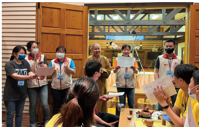
紐約佛光青年團假佛光山鹿野苑，承辦三天兩夜的「2022年北美佛光青年聯誼會暨白象幹部培訓營」。

紐約道場秉持星雲大師提倡人間佛教理念，人間佛教核心以「四大宗旨」為弘法目標，以教育培養人才，因此從小培養，成立中文學校、童軍、青年團、傳燈分會、國際佛光會等。