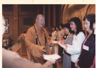
1st Annual Outstanding Women in Buddhism Fellowship Conference 第一屆世界佛教傑出婦女會議