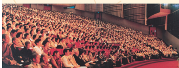
BLIA Chunghua's official inauguration. Ven. Master Hsing Yun was elected as the President. 326 subchapters were established. 中華佛光協會成立大會，星雲大師被推舉為會長，326個分會同時成立