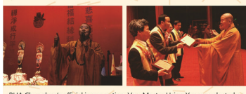
BLIA Chunghua's official inauguration. Ven. Master Hsing Yun was elected as the President. 326 subchapters were established. 中華佛光協會成立大會，星雲大師被推舉為會長，326個分會同時成立