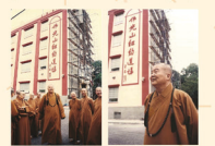
Ven. Master Hsing Yun arrived FGS New York Temple 星雲大師在佛光山紐約道場