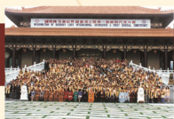
The inauguration of BLIA WHQ at Hsi Lai Temple, Los Angeles. 國際佛光會世界總會成立暨第一次會員代表大會於美國洛杉磯西來寺舉行