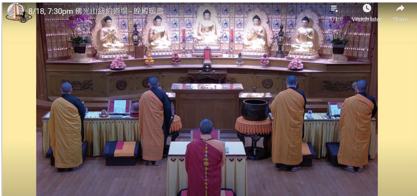
文 / 心甄

8月18日佛光山紐約道場舉辦了一場殊勝的法會為「星雲大師暖壽」，線上線下約120餘位佛光人和護法信徒聚集在道場，整個道場佛光普照，充滿法喜的氛圍。