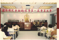
BLIA New York Chapter 1st Annual General Conference 紐約協會第一次會員大會