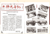
The first issue of New Buddha's Light Newsletter 1995.8 紐約佛光世紀副刊