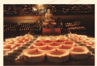
Light Offering 萬人獻燈祈福法會