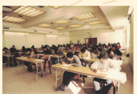
Global Buddhism Exam 世界佛學會考