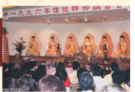
BLIA New York Chapter Leadership Training Seminar 紐約信眾幹部講習會