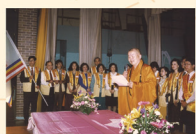
BLIA New York Chapter was chartered 5月2日 紐約協會成立典禮