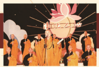
'The Seven Virtues' Series Events 「七誡」系列活動