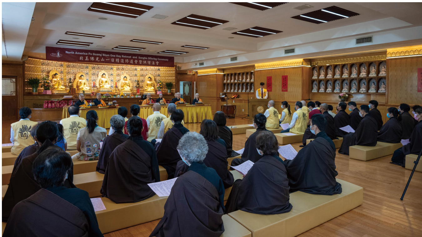
僧俗二眾一起誦經祝禱。