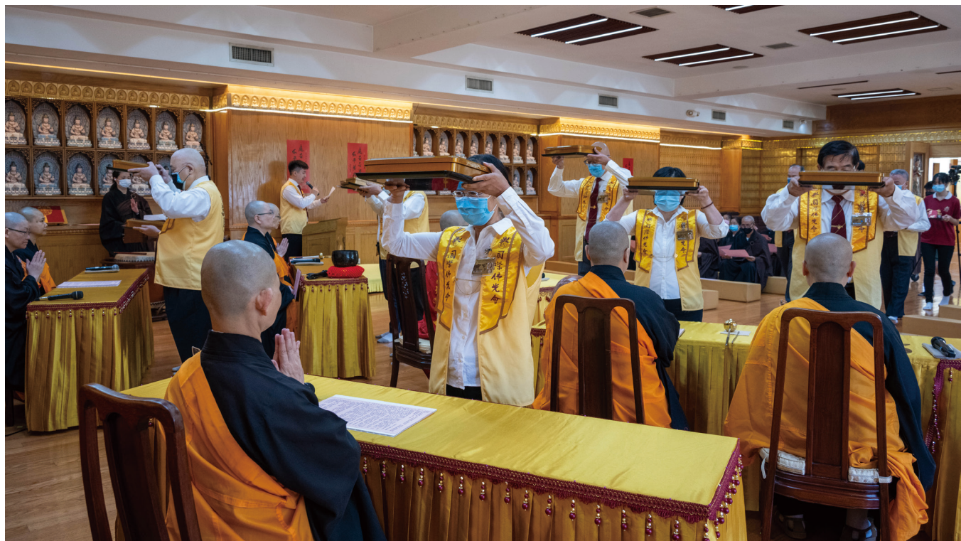
紐約、新州、波士頓三地佛光會幹部一起呈獻供養。