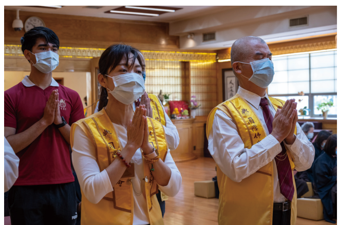
佛光幹部準備供僧。