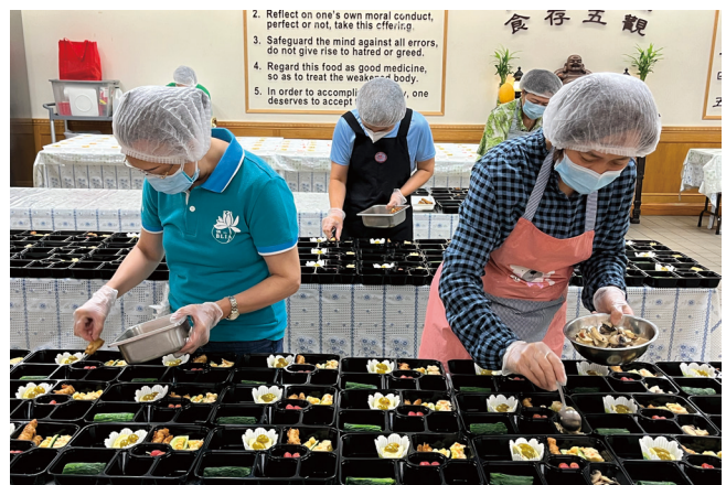
義工仔細為餐盒布菜。