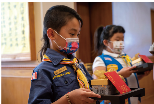
紐約小男女童軍獻供。