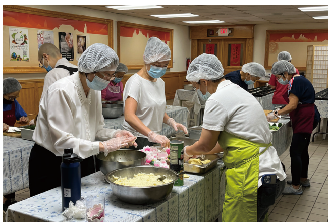
義工準備餐盒所需的食材。