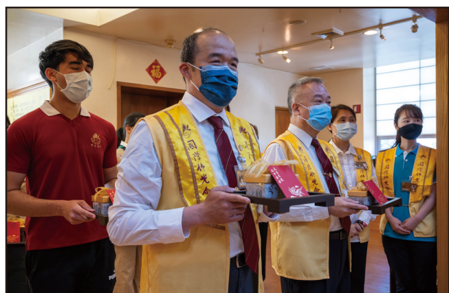
紐約佛光人代表呈現四事供養。