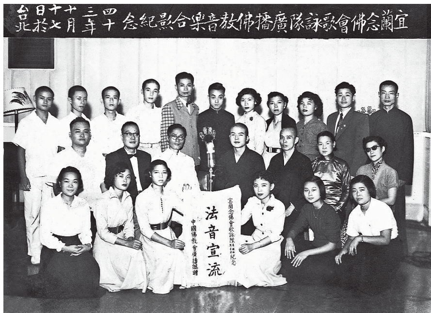
1954年大師帶領宜蘭青年歌詠隊到廣播電台錄音，藉法音宣流傳遞佛法。

數十年來，「佛光山梵唄讚頌團」巡迴於五大洲，曾經在三十多個國家地區舉辦音樂弘法大會，登上各大國際音樂殿堂，如倫敦皇家劇院（London Royal Theatre）、德國柏林愛樂廳（Berliner Philharmoniker）、澳洲雪梨國家歌劇院（Sydney Opera House）、紐約林肯中心（New York Lincoln Center）、洛杉磯柯達劇院（Kodak Theater）、