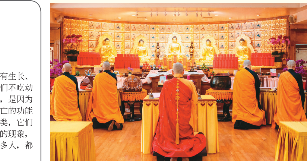
佛光山纽约道场及新州佛光山、佛光山波士顿三佛中心举行「梁皇宝忏与三时系念法会」，现场庄严殊胜。