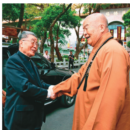
↑星云大师（右）、天主教枢机主教单国玺，友情超越宗教藩篱，经常联合举行活动。图/资料照片