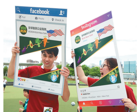
↑纽约佛光青年拿著VEGRUN看板，邀请大众打卡照相。