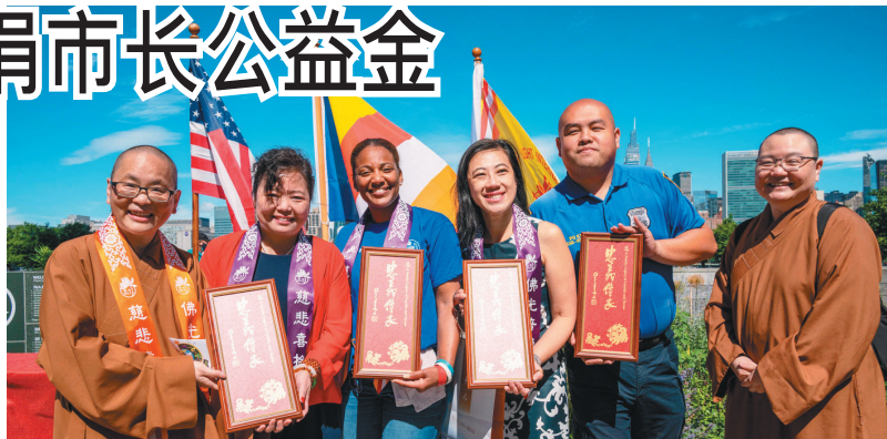
↑佛光山纽约道场住持觉麟法师（左1），赠送星云大师墨宝给纽约市市长助理郑祺蓉（左2）等与会贵宾。

响应VEGRUN，国际佛光会纽约协会举行「您跑步、我捐市长公益金」，纽约州参议员刘醇逸（左2）带领与会者开跑。