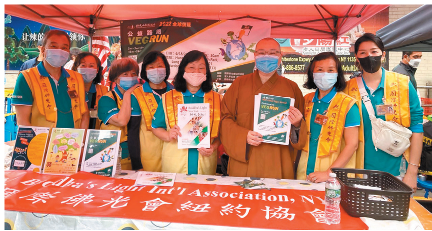
佛光山纽约道场监院有望法师(右3)带领佛光会员，参加「亚裔端午文化节」，宣传VEGRUN活动。