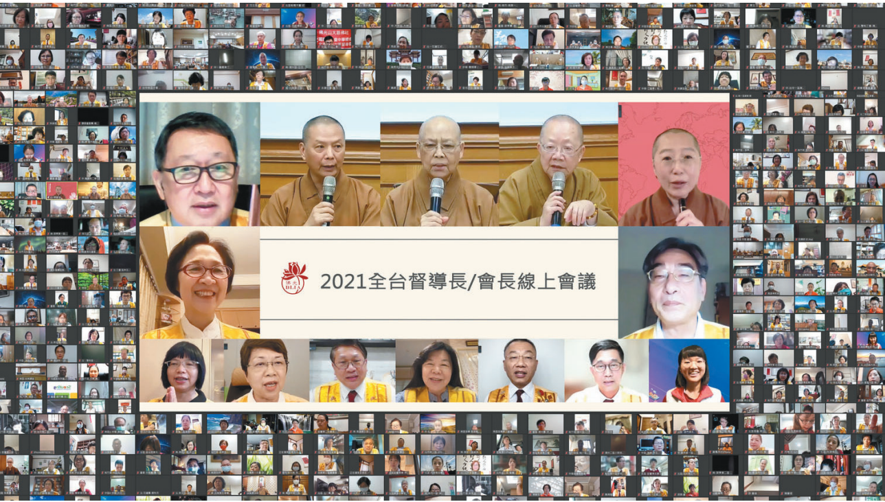
2021 全台督導長/會長線上會議