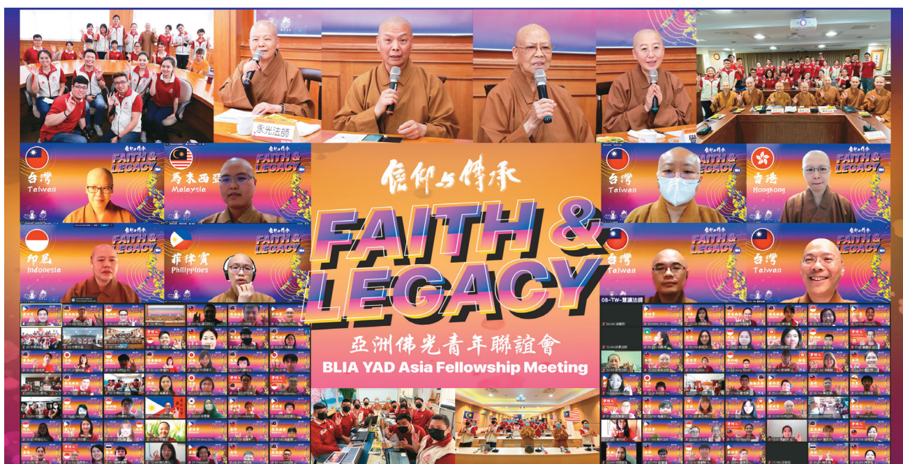
亚洲佛光青年联谊会上，有11个国家地区、430位青年相聚云端。

疫情带给世界无常，同样带领佛光青年突破挑战，团务报告中，各分团分享如何藉由科技之便，发展出多元线上课程、读书会、影音节目、开发佛法桌游、支援道场线上直播等活动利益大众，超越疫情限制。当遇见疫情或灾害发生时，也能发挥人间有情的精神，保有正念，加入救援行列。