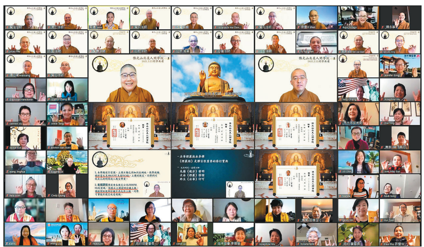
佛光山北美人间学院第一届春季课程开学典礼，逾500人线上参与。

永固法师指出，此次学院成立及云端课程的开展，可以说是「一时千载，千载一时」，能邀请到北美洲各道场的法师担当授课，卓越的师资阵容是十分难得，因缘成就不断