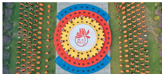
←法会回向後，有「吉星高照」无人机高空灯光献礼，无人机队在空中排成甘露、佛陀拈花、凤凰展翅、莲花等图形，最後出现星云大师合十图形，象徵他出家83年合掌人生，众人感动不已。