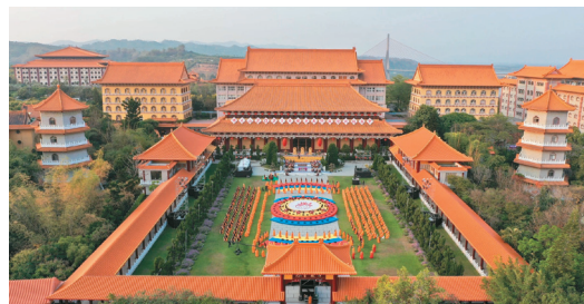
↑↓佛光山2021年禅净共修献灯线上祈福法会，於佛光大雄宝殿成佛大道举行。