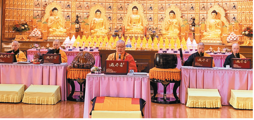
纽约道场监院有望法师（中）主法，以网路直播方式领众拜忏。