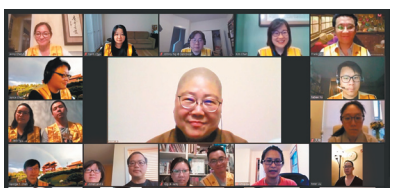
國際佛光會全球傳燈所成立的「網上聯合讀書會」，禮請國際佛光會世界總會美東副秘書長永固法師與會。