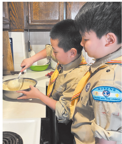
纽约佛光童军团举行「在家露营」活动，正逢父亲节，孩子们烹煮早餐给爸爸享用。

疫情期间的生活平淡，但童军服务员与孩子们努力让生活变得丰富多彩。祈愿疫情尽快过去，平安吉祥，迎接未来。