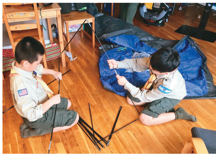
场地虽然不宽阔，但孩子克服障碍齐心搭营。