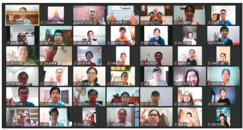
↑线上佛学院师生欢喜合影。

线上佛学院开学典礼在晚上举行，邀请佛光山丛林学院院长妙南法师、佛光山开山寮监寺觉具法师，及觉诚法师共同为新生举行开学典礼。