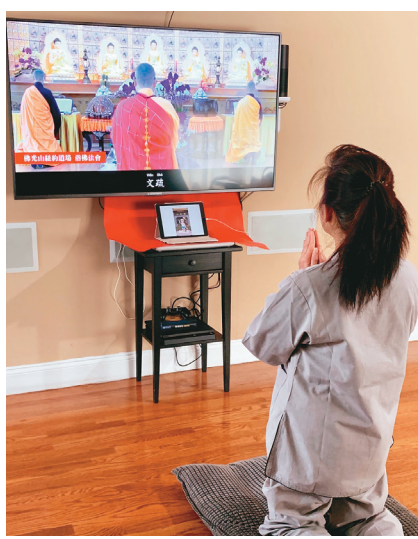
→信众在家同步参与法会。

献一生，只为帮助众生脱离六道离苦得乐。共勉大家要时时提起正念、发菩提心，服务众生。」有望法师进一步指出，星云大师曾开示，浴佛时要发愿「与佛眼相应，体恤众生之苦；与佛口相应，常说正面善美之言；与佛身相应，尽力多做利益他人之事；与佛心相应，祈愿众生早日离苦得乐」，才