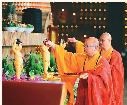
↑「佛光山2020年庆祝佛诞节」在佛光大雄宝殿举办浴佛法会直播，佛光山住持心保和尚（前）带领大众浴佛。