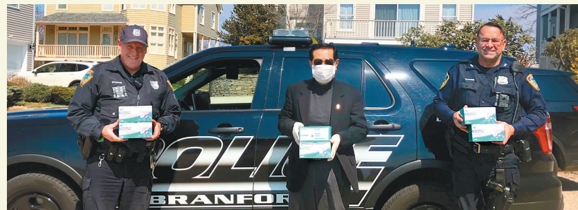
↑佛光山纽约道场、国际佛光会纽约协会合力分发医疗物资给医护、警消机构。图为李昌钰博士(中)转赠来自纽约道场的口罩，给康州新天堂区警员们。