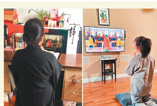
佛光山纽约道场、新州佛光山及波士顿三佛中心共同举行清明法会，以线上视讯方式进行，让信众同步参与。