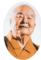
星云大师/Venerable Master Hsing Yun

能不计个人得失，才能因谋万民之福祉。 Indifference to gain frees you for great service.