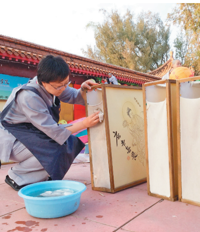
文与图/佛光山丛林学院

佛光山新春平安灯法会圆满，全院师生参与出普坡（注）。走进头山门，沿途总能见脸上带著笑容，欢喜参与常住作务的学生，不分你我齐心协力，从拆灯柱、压平灯笼、到灯泡线的整理与分类，专注当下每个环节的衔接，都是学习合作分工的最佳机会，透过沟通配合与协助，除能有效率地完成作务，更能从中发挥自己的力量，体现自我价值。