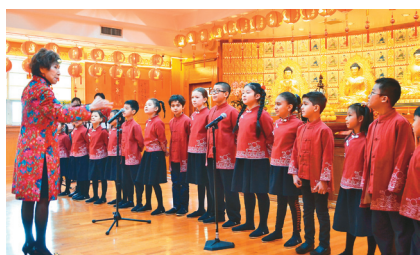
↑初二新春文化表演，佛光山纽约道场儿童合唱团参与演出。