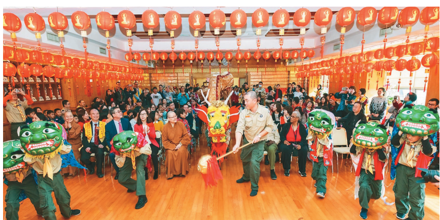
↓佛光山纽约道场幼男童军献上舞龙舞狮表演，向大众拜年。

【人间社记者谢佩芸纽约报导】佛光山纽约道场24至26日举行庆祝新年系列活动，邀约民众来到道场一同迎接新的一年，祈愿欢喜降临、国泰民安、平安健康。