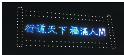
↑缓缓展开的卷轴，喜现星云大师今年题写的新春贺辞「行遍天下，福满人间」。

最精采的是，夜空中出现一幅卷轴，当卷轴缓缓打开，出现佛光山开山星云大师为今年题写的新春贺