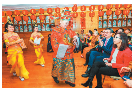
↑佛光山纽约道场举行庆祝新春系列活动，佛光人扮成财神爷向与会嘉宾贺岁。