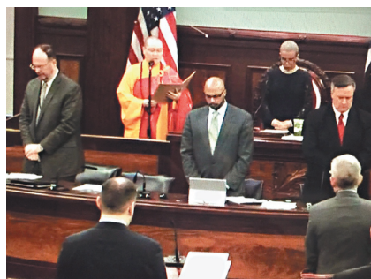
↑监院有望法师进行祝祷仪式。