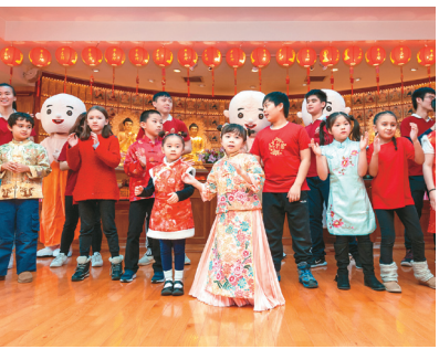
佛光合唱团、佛光儿童合唱团、纽约佛光青年团及纽约佛光小女童军表演歌唱。