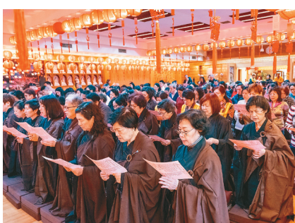
新春礼千佛法会上，信徒虔诚诵经祈福。