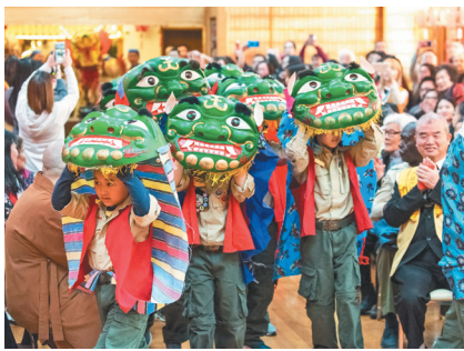
佛光小男童军以舞龙舞狮为新春文化表演开场。