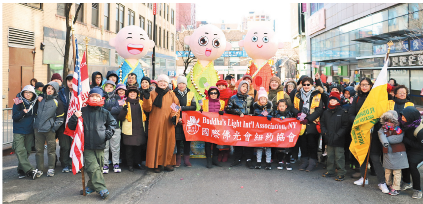
纽约新春大游行 三好娃娃最吸睛

纽约市最大的新年庆祝活动——法拉盛新春大游行9日登场，佛光山纽约道场法师、国际佛光会纽约协会会员及纽约佛光童军团等近百人参加，三好娃娃亦穿梭队伍间，引人注目。数千民众一起庆祝农历新年，也可看到不同族裔民众参加，足见法拉盛多元民族的融合。