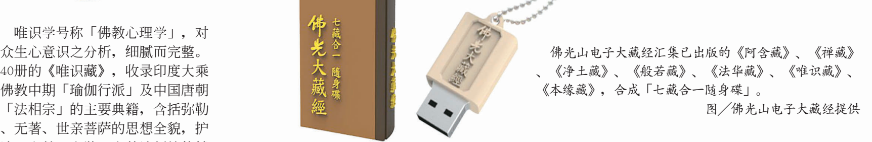
佛光山电子大藏经汇集已出版的《阿含藏》、《禅藏》、《净土藏》、《般若藏》、《法华藏》、《唯识藏》、《本缘藏》，合成「七藏合一随身碟」。