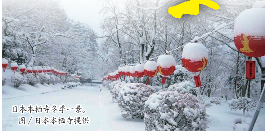
日本本栖寺冬季一景。