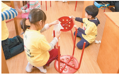
中文学校小菩萨参与扫除，细心擦拭椅子。