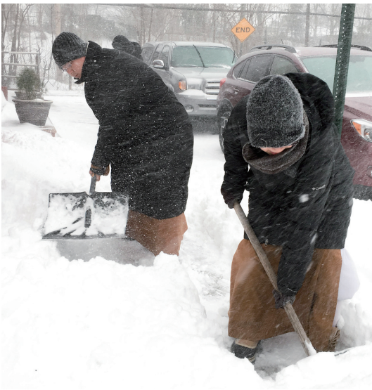
佛光山纽约道场法师为寺院旁的道路铲雪，而道场的小沙弥个个带着「雪帽」，模样逗趣。