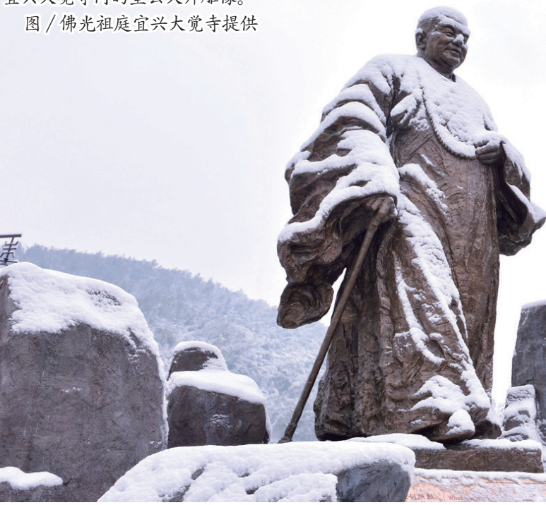
宜兴大觉寺内的星云大师雕像。

International Buddhist Progress Society, New York 154-37 Barclay Ave., Flushing, NY 11355 Tel: (718)939-8318 Fax: (718)939-4277 E-mail: newyork@ibps.org www.fgsny.org