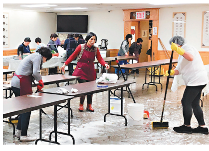
佛光山纽约道场举行出坡活动，佛光人发心清理环境。

纽约协会各分会会长也积极地发动佛光会员参加出坡，与道场义工们一同清扫整理纽约道场的每个楼层，发挥集体创作的精神，让道场焕然一新。