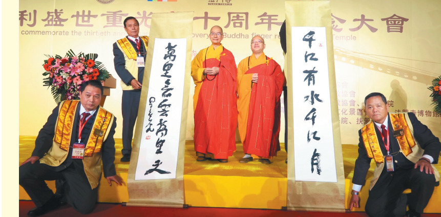
↑结盟仪式上，心保和尚（右二）代表星云大师，以墨宝祝福法门寺、佛光山寺、香港宝莲禅寺的结盟，并与学诚大和尚（左三）合影。

心保和尚表示，两岸法乳交融，一脉相传；法门寺素与佛光山寺、以及佛光山开山星云大师有著深厚的渊源。今年9月，学诚大和尚亦