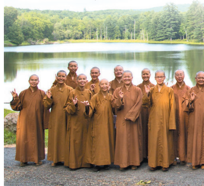
参加培训课程的法师们於鹿野苑湖边合影。

【人间社记者林芝莹、觉皇纽约报导】佛光山北美洲道场为培养带领英文禅修之僧才，15日起一连4天於纽约佛光山鹿野苑，举行首次「北美英文禅修培训课程」，驻锡於美国与加拿大的法师逾20人参加。期盼培养以英文禅修的法师，带动美加当地人士理解禅修真正的意义与精神，落实星云大师的「本土化」理念。