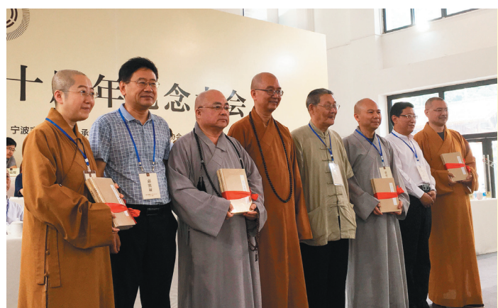
中国佛教协会会长学诚法师(左四)赠《人间佛教思想文库》学术研究系列书籍，给人间佛教研究院院长觉培法师(左一)、法鼓山果东方丈(左三)等与会者。