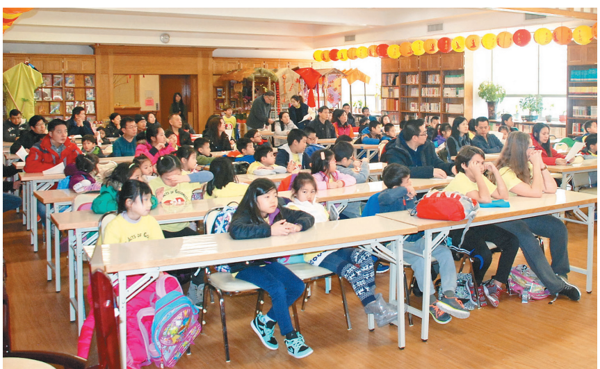
纽约佛光山中学校春季班举行开学典礼，同学及家长齐聚般若堂。