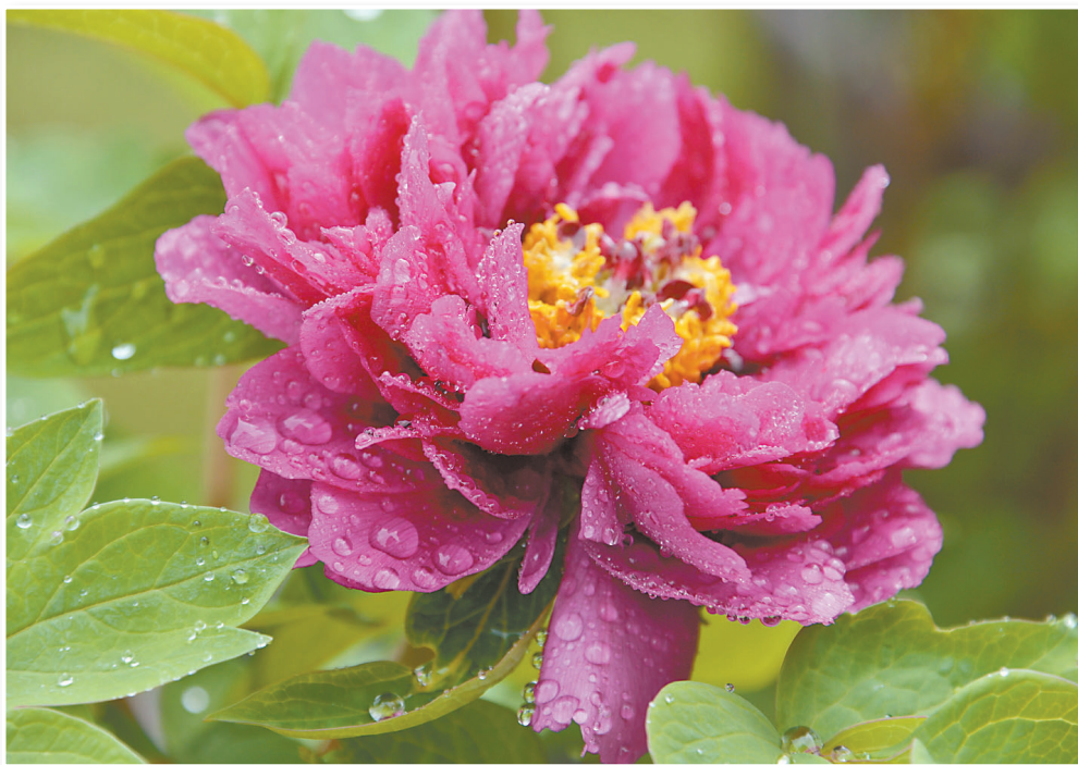
↑→中国大陆牡丹之乡菏泽来到高雄佛光山了！今年春节期间盛开，巅峰期可同时欣赏将近一万五千朵牡丹花，欢迎大家来见证奇迹。

「第一次在低海拔地方种植」。山东属北温带，每年都有零下十度的气候，四季分明，台湾属热带气候，温度高、湿度大，容易长叶片