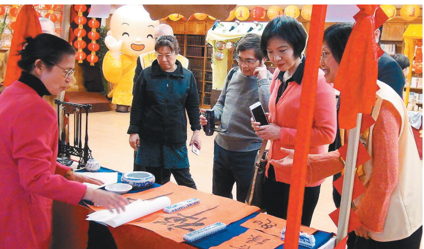
佛光山纽约道场安排一系列活动庆祝新年。

在参学的岁月里，对社会、对人生、对五欲六尘的看法又有所不同。这时候，贫僧虽不爱财但「好名」，希望别人知道自己是一个好人、是一个健全的人、我比别人优秀。但在佛教法海成长期中，年近三十，观念又全然不同了。（待续）