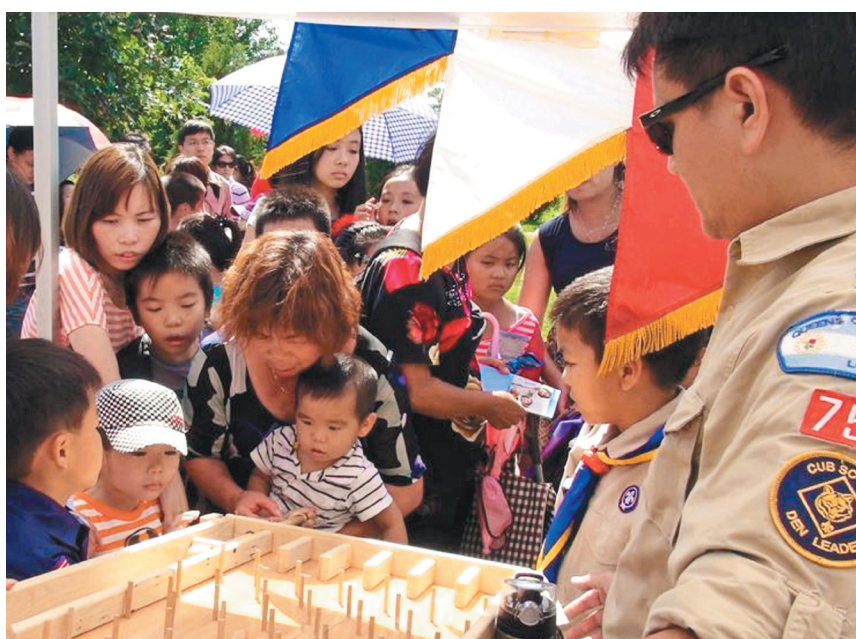
佛光童军以弹珠游戏向孩童介绍童军团的课程。 图/人间社记者何秀玲

佛光童军团及中文学校以活泼的教育方式，使前来摊位的人潮络绎不绝，孩童参与挑战游戏，家长则来洽询如何加入童军团及中文学校。一天下来，虽顶著炎热的太阳，但大家发挥佛光人的精神，以实际的行动，协助社区儿童提高生活品质。