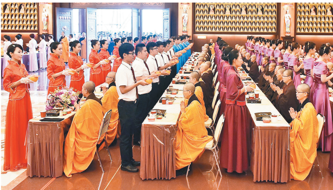
由佛光人和佛光青年组成的献供队伍，井然有序地走到法师面前，虔诚献上供斋。