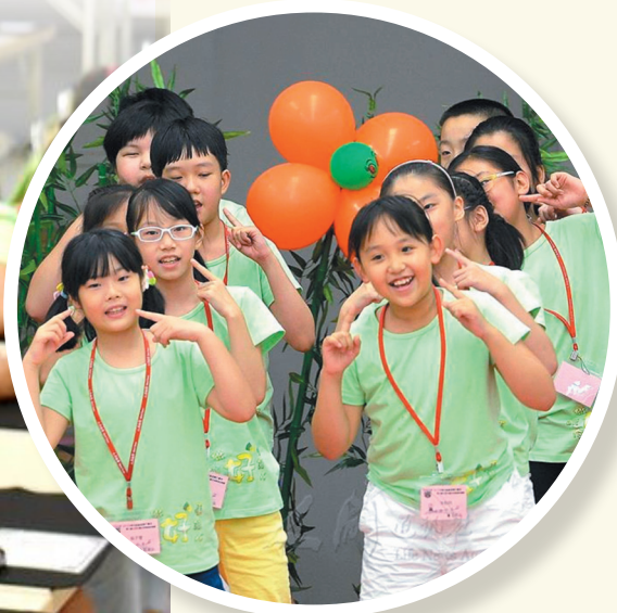
↑ 小學員們大家一起表演、舞蹈，沉浸在歡喜中。