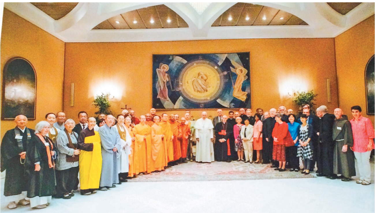
教宗与出席梵蒂冈「佛教与天主教对谈研讨会」的各国代表合影。