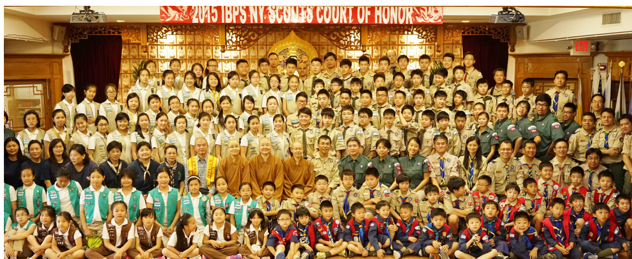
↑纽约佛光童军团举行年度结营典礼，众人合照後相约九月开营再相见。

在木质徽章颁奖仪式过後，随即颁发各项年度重要徽章，如三位女童军及十八位幼男童军完成近三十个小时行解并重的宗教课程，所获得的宗教徽章。还有由今年即将晋升为大男童军的九位幼男童军完成所有必经的训练及要求後，获得幼男童军阶段最高荣誉的「金箭