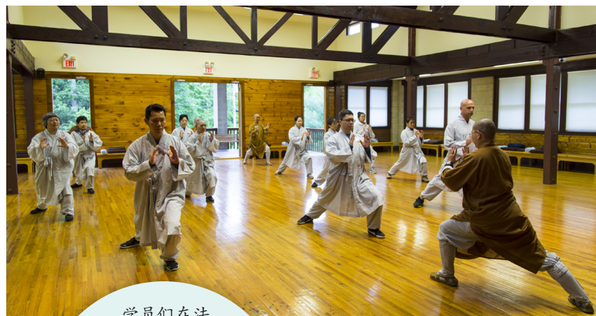
学员们在法师细心照料引导下，照顾住行、住、坐、卧每个当下，徜徉在优美的山水胜境，与大自然和谐共生，参究本来面目，领略心地风光。