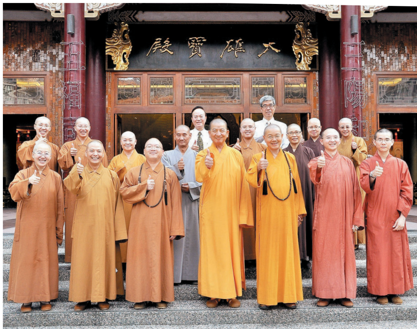
「中华人间佛教联合总会」第二次筹备会在佛光山三峡金光明寺召开，大众会后合影。

灵鹫山佛教基金会董事长恒传法师表示，「中华人间佛教联合总会」是大师的心愿，希望让佛教界有个增进彼此交流的平台，对人间、佛教、社会、国家有实质助益，家师也希望能参与，一起成就大愿。「大家信仰的是同一个教主，且