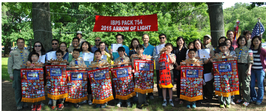
获奖的幼童军们，在父母的陪同见证下，共享这一分殊荣。

当日典礼中，共有九位幼童军获得此项荣耀，获奖者依序由父母亲陪伴出场，发表感言，父母亲更为自己的小孩於过去五年的成长感到骄傲，现场温馨感人，整场活动在薪火相传仪式後，圆满结束。