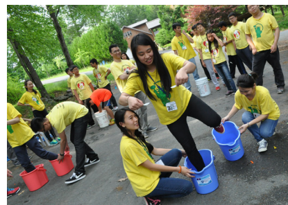
三好儿童夏令营的小队辅们，在游戏中齐心共进。

三十一日结营典礼，营长带领所有小队辅感谢常住、辅导法师，还有香积组义工菩萨们的护持，成就这次训练营圆满。