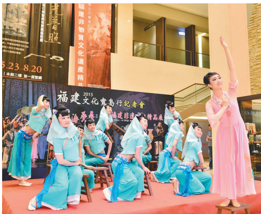
《丝》剧表演人员在现场演出一小段舞剧，婀娜多姿的身段与生动丰富的表情，让观众目不转睛。

【人间社记者谢盛堂高雄报导】为发扬福建非物质文化遗产、促进两岸交流共享和谐，中国福建省文化厅今年以「二〇一五福建文化宝岛行」为主题，首度带来大型舞剧《丝海梦寻》与近两百多件非物质文化遗产项目工艺品来台展演，日前在佛馆举办记者会，邀请展出艺术传承人为观众解答、展示绝技。曾在法、美、比利时联合国总部巡演、广受好评的《丝海梦寻》一剧，於佛陀纪念馆演出後，三、四日移师台湾艺术大学表演。佛馆本馆第二展厅展出福建非物质文化遗产精品项目，包含天工意趣、寿山石雕、莆田与惠安木雕和畚族银器等近两百件艺术精品，展期至二十八日。佛陀纪念馆馆长如常法师表示，《丝海梦寻》与福建非遗项目工艺品於佛馆展出，在传达「一带一