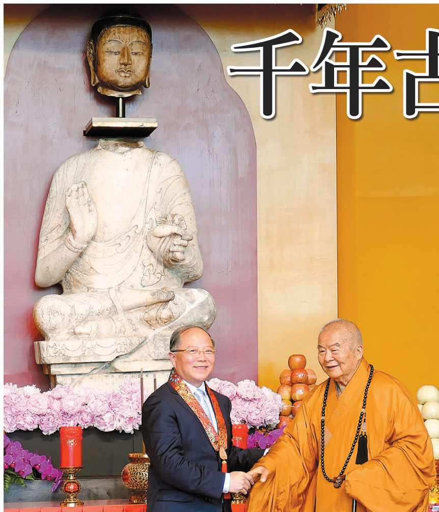
佛光山开山星云大师（右）、中华文物交流协会会长励小捷，连袂见证千年古佛金身合璧。