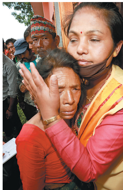
印度佛光人紧紧抱著罹难者家属，深感不舍。

四合一救援总队留下代表台湾、代表佛光山及各界的爱，虽然是面对苦难的灾民及灾区，但每个团员都甘之如饴，各自完成自己的工作，几天相处联结了团员们的爱心。