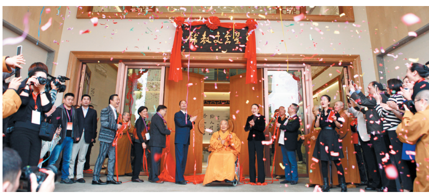
佛光山开山星云大师为上海星云文教馆揭牌。