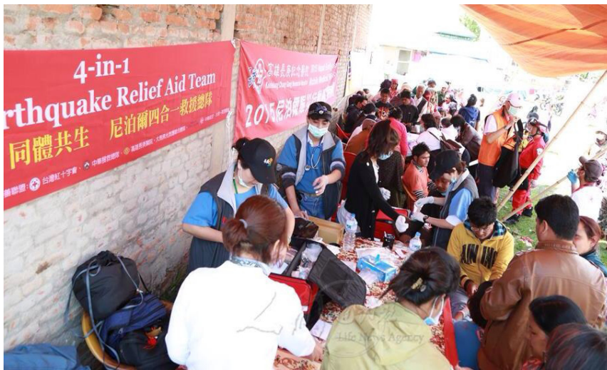
佛光云水医疗队、高雄长庚医疗队、中华民国搜救总队、马来西亚佛光救援队协同设立医疗站，提供灾民医疗服务。

此次救援行动，除了医疗、人道救援外，救援团队还带近五千公斤的物资前往援助，高振群说：「这