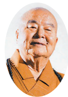
星云大师 / Venerable Master Hsing Yun

创意的产生，来自用心於身边的琐事。 Creativity requires attention to the trivial around you.