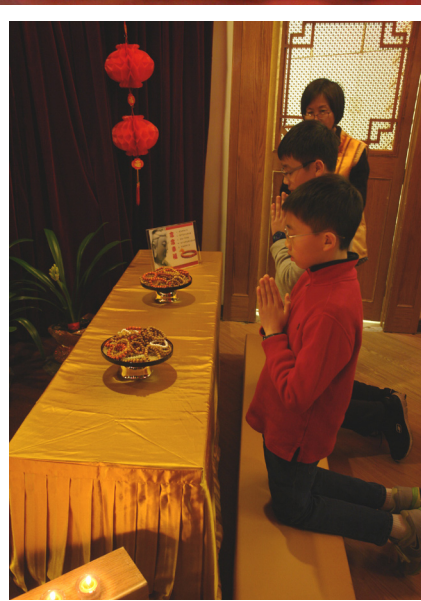
小朋友向菩萨祈愿，同时奉请念珠，带回念念幸福。

初一由住持觉泉法师主持「新春礼千佛会法会」，当日涌入近千名社区人士至道场上年香、吃素斋。系列活动持续至初四，另有千余人前来品尝各种美味素食，有：麻辣烫、筒仔米糕、碗粿、车轮饼、珍珠奶茶等近四十种小吃。「新春文化表演」随即於观音殿举行，节目精采，分别有小男童军的舞龙舞狮、青年团手语Harmonize、扯铃、吉他与爵士鼓弹唱、黄梅调戏凤、中西乐器钢琴等，赢得满堂采。