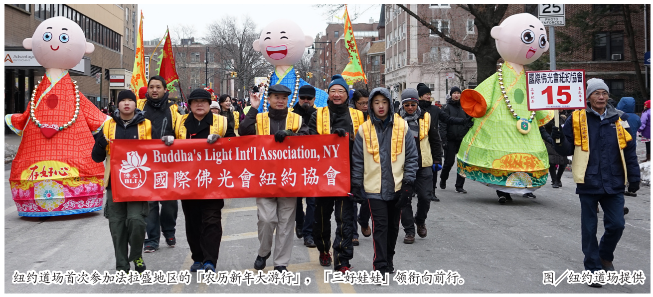
纽约道场首次参加法拉盛地区的「农历新年大游行」，「三好娃娃」领街向前行。

最特别的是纽约道场首次参加法拉盛地区的「农历新年大游行」，觉泉法师亲自带领佛光会员、童军、青年等三十多人，及「三好娃娃」全程参加游行。透过走入社区、亲近大众，「三好娃娃」所经之处，各籍人士及小朋友们争相合照及询问三好意涵，并愿意向「做好事，说好话，存好心」学习。本活动让「三好」的种子传播到法拉盛社区，让人间佛教的理念走进人心。