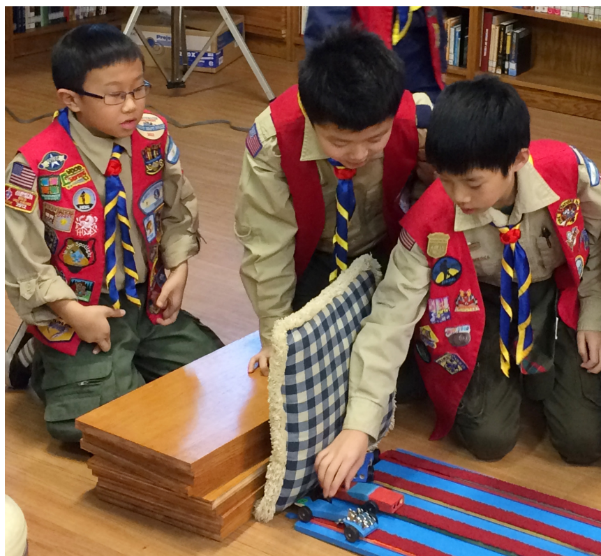
纽约佛光男幼童军参与车赛较量竞技，学习在寓教于乐的益智过程里，展现运动家的精神。