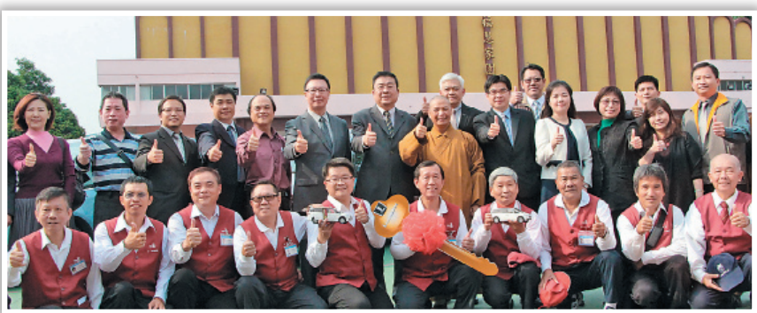
佛光山电动汽车启用仪式圆满，开启绿能运具的里程碑。