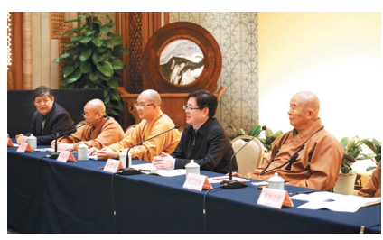
两岸中青年佛教人士联谊交流会。

育、体制健全等问题，王作安希望能借镜星云大师在台湾弘法的丰硕成果，作为未来发展的方针。他勉励大众常保一颗愿意交流的心，弘扬中华传统文化是两岸共同的责任，需要全球华人一起传承、推动。