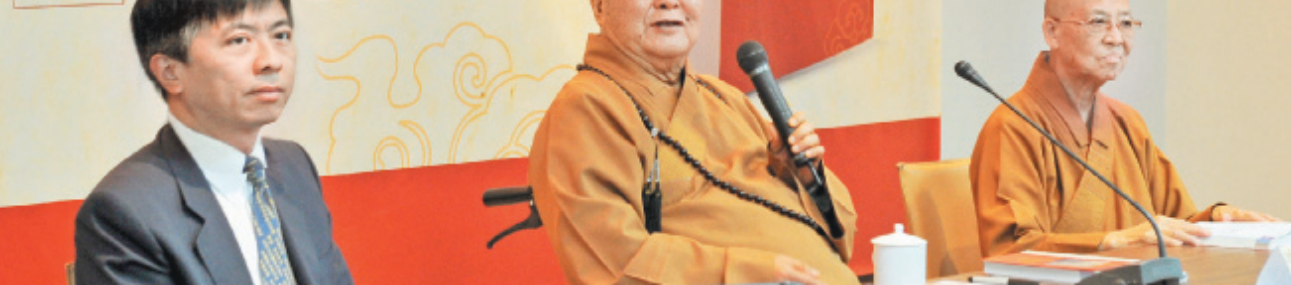
星云大师（中）出席《献给旅行者365日—中华文化佛教宝典》赠书发表会，左为云朗观光集团总经理盛治仁，右为国际佛光会世界总会副总会长慈容法师。

【记者罗智华台北报导】经常旅行的人都知道，各国旅馆里常摆放《圣经》供基督或天主教徒阅读，但对其他信仰或一般民众来说，却始终没有一本普及化的精神资粮来滋养旅途心灵，如今这样的缺憾，将透过佛光山开山星云大师总监修的《献给旅行者365日—中华文化佛教宝典》获得圆满。