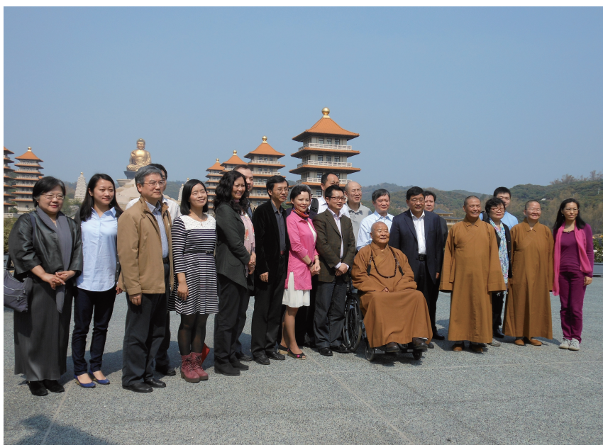
星雲大師會見大陸文化人，感謝他們長期支持佛光山人文教活動。

為了感謝長期支持佛光山人文教活動的大陸文化人，星雲大師特別現身致意。對於星雲大師意外出現，眾人驚喜之餘，紛紛與大師合影留念。