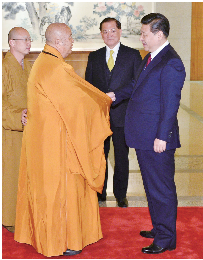
佛光山開山星雲大師（左二）隨國民黨榮譽主席連戰（右二）訪問北京，與中共總書記習近平（右一）見面。

現在，我們除了中華文化在世界上獨占鰲頭，在士農工商、科技、經濟的建設上，也逐漸凌駕世界各國。不過，我們並不希望老百姓只追求財富的增加，成為暴發戶，尤其士農工商各界，更應共享共有，除了改善社會經濟，提升生活品質，也希望人民在心靈上獲得富足