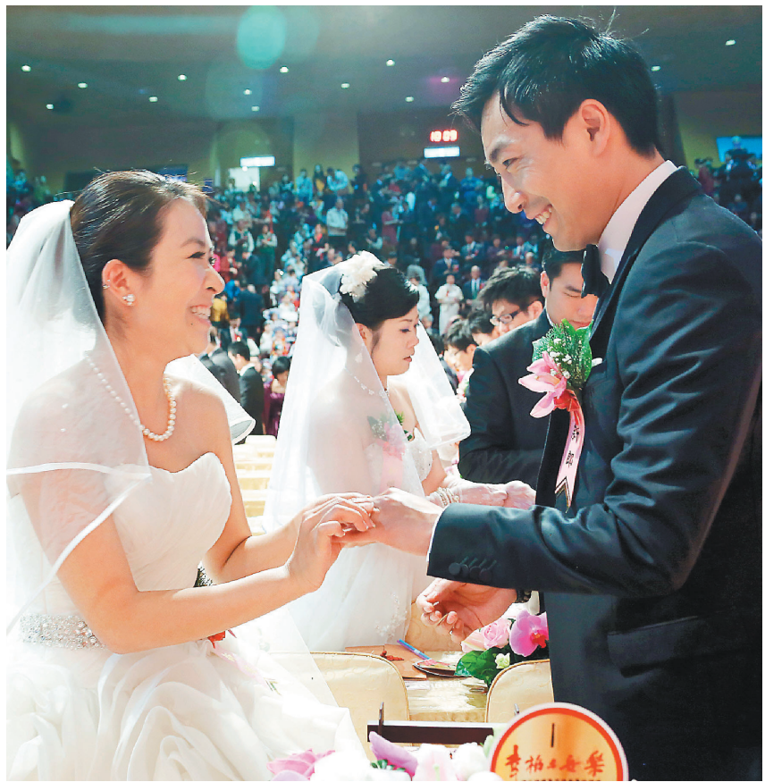
佛光山舉辦「幸福與安樂—佛化婚禮暨菩提眷屬祝福禮」，來自全球百對新人締結良緣。

典禮最後，由佛光山寺住持心保和尚領衆誦讀星雲大師所撰〈佛化婚禮暨菩提眷屬祈願文〉，祈求佛陀加持，人人建立美滿幸福的家庭，成爲善因善緣的菩提眷屬。在〈美滿姻緣〉的大合唱中，新人與菩提眷屬致謝證婚人、介紹人、來賓及親友，花童則發喜糖給觀禮佳賓，典禮在歡喜溫馨氣氛下圓滿。