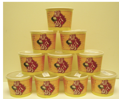
佛光山紐約道場紀念佛陀成道，以「臘八粥」與大眾結緣。

佛陀修道時，爲了思維人生的真諦，曾歷經六年苦行，終至形銷骨立。後於尼連禪河邊，接受牧羊女乳糜供養，體力逐漸恢復，於是端坐菩提樹下沉思，終於在十二月八日這天，夜睹明星，悟道成佛。之後佛教信衆爲了紀念佛陀成道及牧羊女供養乳糜