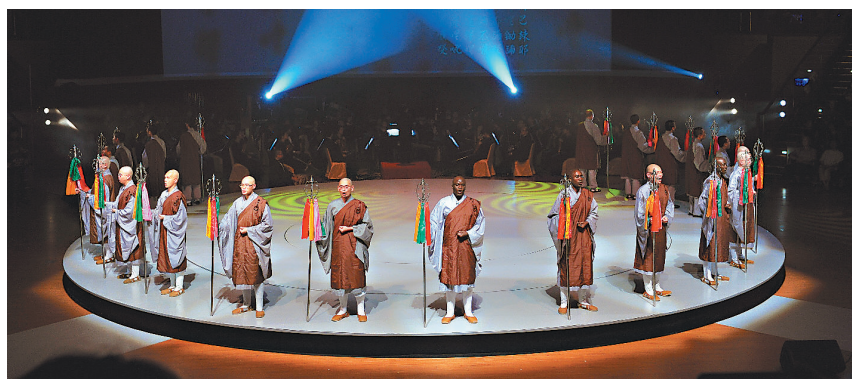
佛光山梵唄讚頌團將佛教鐘、板、鈴鼓、引磬帶上舞台，展現佛教叢林生活原貌。

一個多小時的演出，大眾意猶未盡，頻呼安可，佛光山梵唄讚頌團最後獻上〈佛光山之歌〉與〈志心信禮〉，在耳畔餘音繞梁中圓滿。