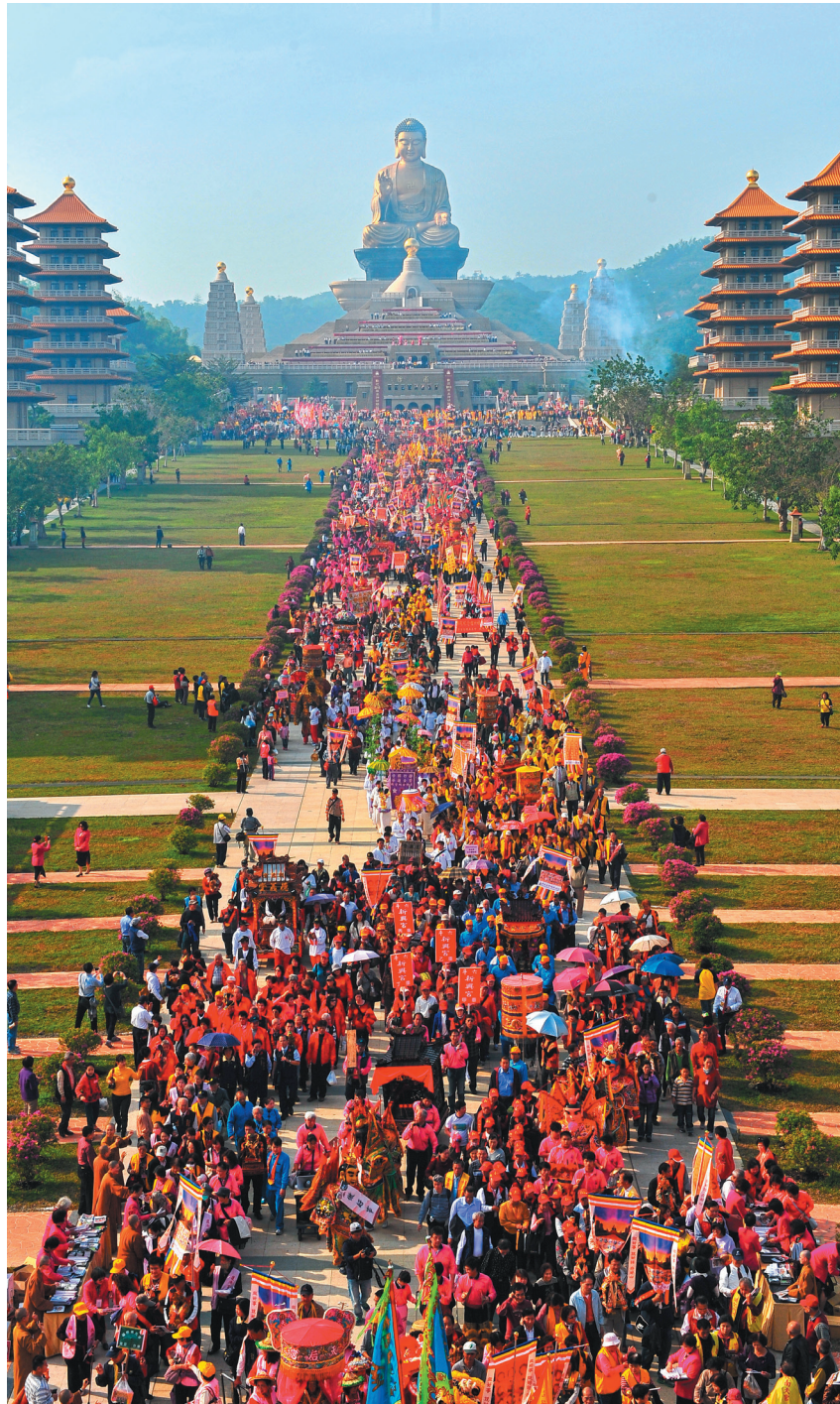
來自兩岸釋、儒、道三教共兩千餘尊神明、一千家宮廟、五百組陣頭到佛館聯誼，宛如一場「宗教聯合國」盛會！

來自各地的神明，暫奉於佛館近三小時後，下午在萬人照相台舉行「祈福法會」，由心保和尚引領萬眾唱念〈佛寶讚〉與星雲大師所撰〈為社會大眾祈願文〉；接續回鑾儀式，由佛光山法師授予「九品蓮花佛祖旗」，此時現場冲天炮、鞭炮聲不斷，來館拜佛的全數信眾、神轎、陣頭齊聚，還有三太子跳騎馬舞，神明聯誼會也在嘉年華般的熱鬧氛圍中圓滿。