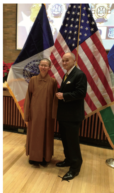
代表，合影留念，在一片祥和歡喜的氣氛中圓滿結束。