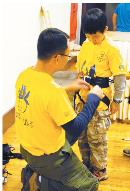
童軍領隊協助小男童學習戶外野營裝備設置。