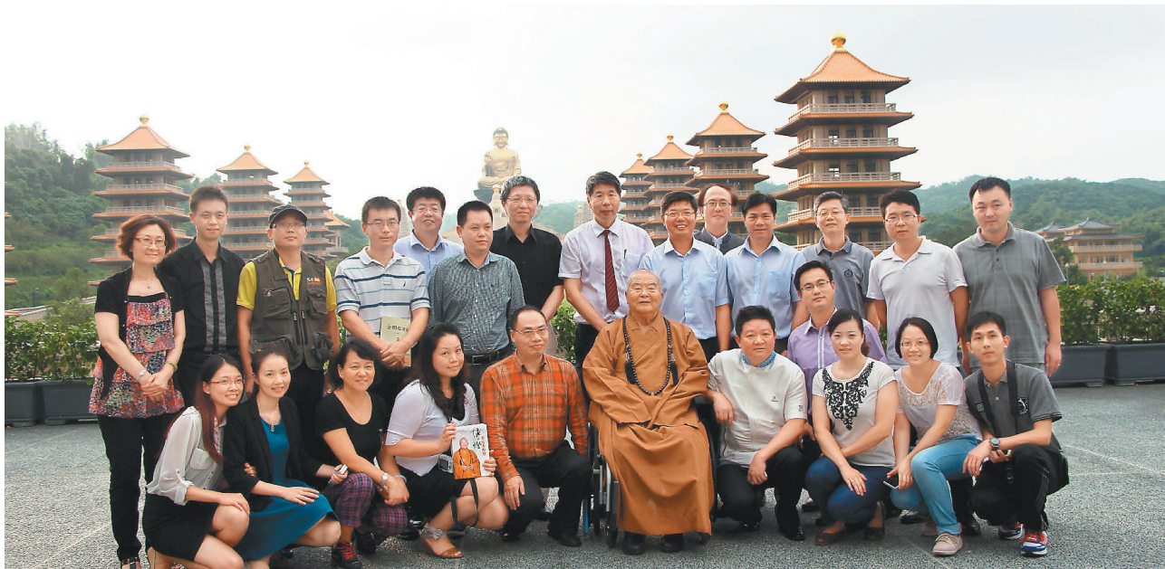
「對話雲時代之全球化背景下的中華文化傳播研討會」與會成員，歡喜和佛光山開山星雲大師（中坐者）合影留念。

「有錢是福報，會用錢才是智慧。」星雲大師最後勉眾人，「錢財不是唯一，要會用錢。」金錢只是用來造福人間、廣結善緣，播種用的，滿足比金錢重要，就如健康、人緣、和平都是用金錢買不到的，並強調「人要快樂，享有比擁有和占有好，吃虧也不要緊，要相信種什麼因得什麼果，因果不會辜負我們。」